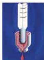
Détermination du point de goutte

Auparavant, les spécifications à haute température des graisses étaient basées sur le point de goutte de la graisse ( Fig. A ). Principalement destiné à confirmer la bonne tenue de l'épaississant dans le cadre d'un test de contrôle qualité de fabrication, et non à être utilisé comme indicateur de performances, le point de goutte indique la température à laquelle l'épaississant de la graisse perd sa capacité à retenir l'huile de base dans les conditions du test. Dans le meilleur des cas, il y a une faible corrélation avec les performances à haute température en conditions réelles. Il est malgré tout assez courant de définir la limite de température élevée de la graisse, en soustrayant une température nominale ( souvent 55°C ) au point de goutte de la graisse.